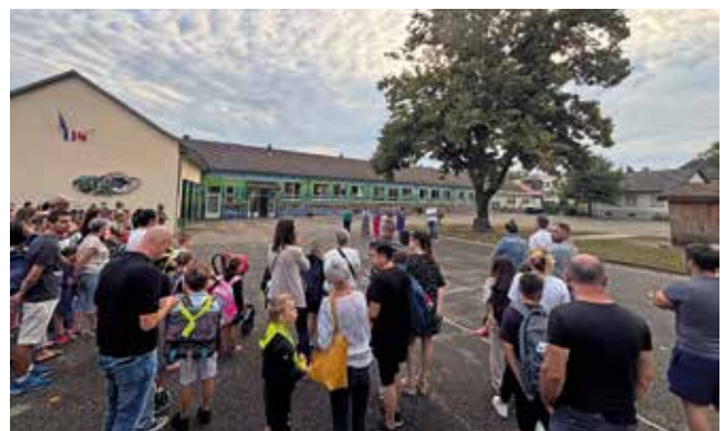
École élémentaire la Sirène de l'Ill