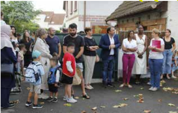
École maternelle Centre