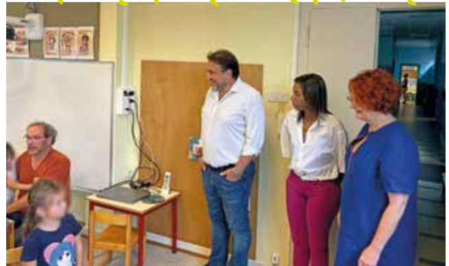
École maternelle la Sirène de l'Ill