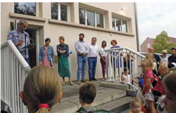
École élémentaire Prévert